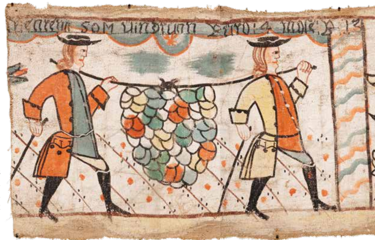
Detalj av Nils Lindbergs "Spejarna med druvklasen", datering oklar, textil, 114 x 41 cm, UJH 3002