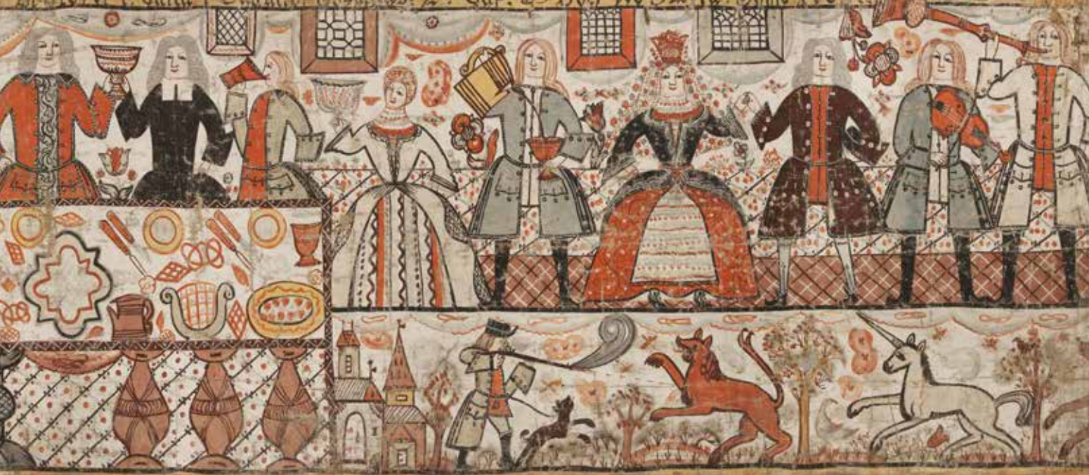
Detalj av Nils Lindbergs "Bröllopet i Cana i Gallileen" 1763, textil, 273 x 87 cm, UJH 3001