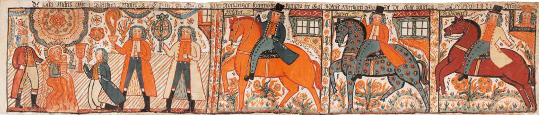
Sunnerbomålning, proveniens oklar, 1821, 240 x 50 cm, papper, UJH 3077 Bonaden skildrar i en våd hur de vise männen i första bildfältet uppvaktar Barnet i Marias knä, varvid vi till höger därom får se deras ritt dit med var sin häst i ett eget bildfält. Längst bort uppe i högerhörnet syns Herodes ansikte titta efter dem som genom ett fönster. Josef står bakom Marias stol och håller en hand på stolsryggen. Han visar ingen notis om mössan på sitt huvud medan de vise männen är barhuvade, hattarna de hade under ritten är borta.

pappersark. Bygdens alla gubbar som jobbade där fick ingen lön och bruket höll på att göra konkurs. Det blev allvarlig kris och här träder kvinnorna fram. Döttrarna, fruarna och gummorna ger sig på att måla bonadsmotiv på de svårsålda arken. Kreativiteten flödar när de respektlöst bryter med invanda traditioner. Sunnerboskolan experimenterar,