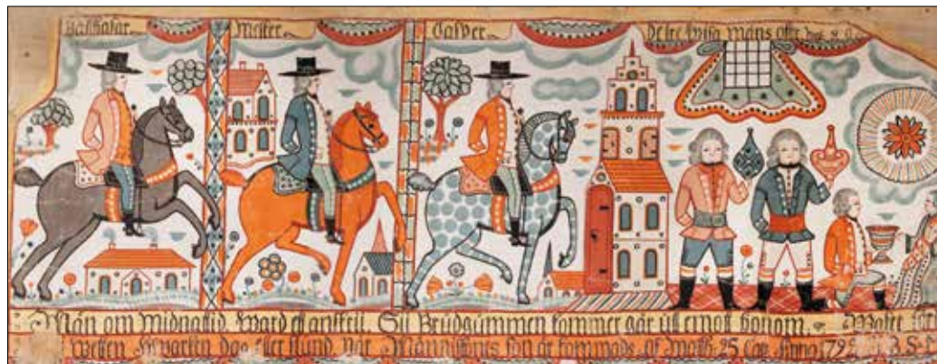
Detalj av Johannes Nilssons "De tre vise männen", 1792, textil, 200 x 130 cm, UJH 3011

Kultur och välstånd började utvecklas under Frihetstiden från mitten av 1700-talet. Efter århundradens stormaktsplaner, krigföring och