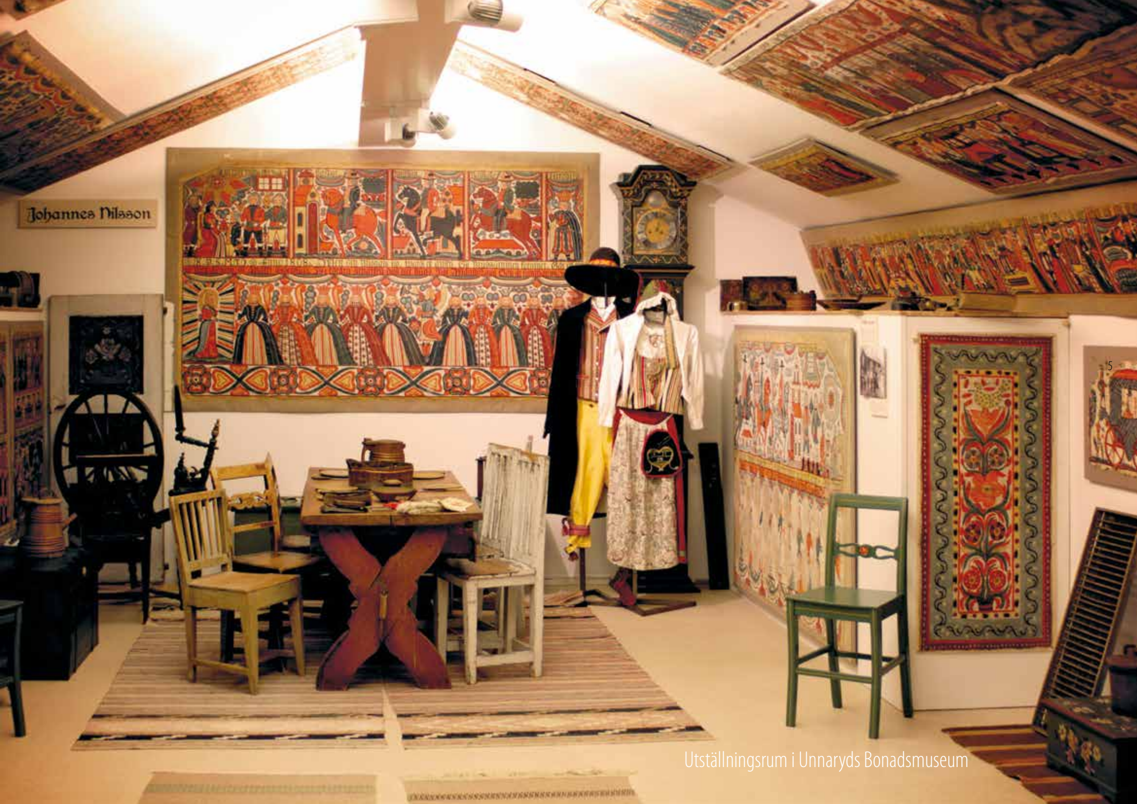
Utställningsrum i Unnaryds Bonadsmuseum