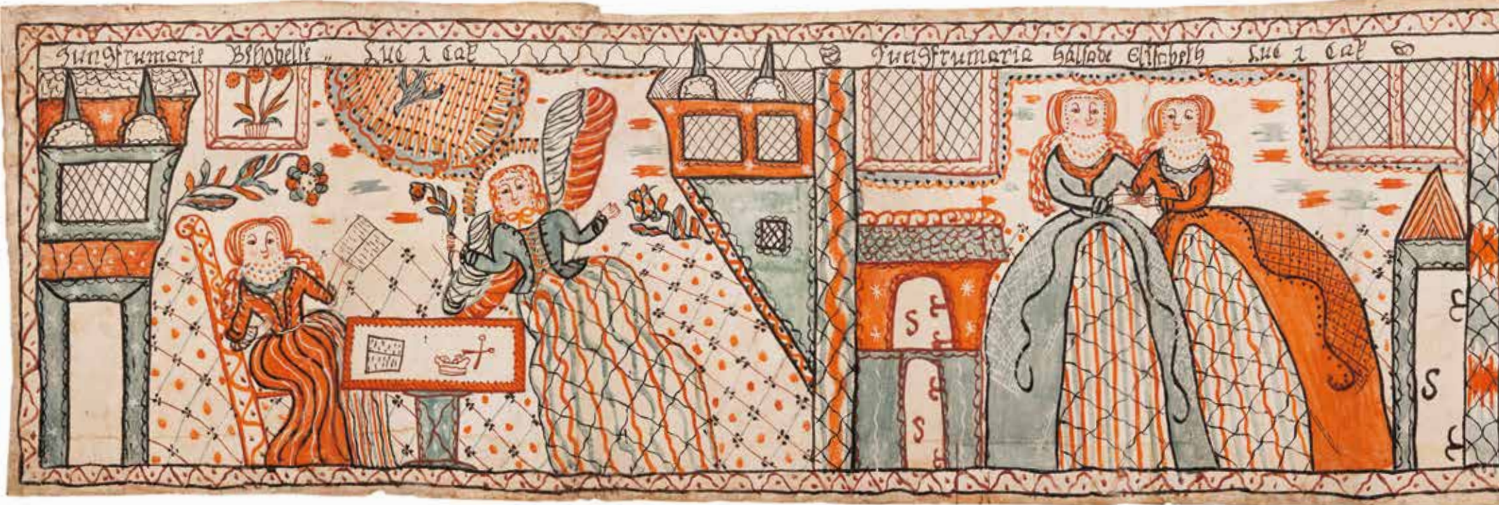
Detalj av Sunnerbomålning. "Maria bebådelse, Maria och kusinen Elisabeth", 1805, sammanfogade pappersark till en "siäsaribba", 417 x 53 cm, UJH 3071