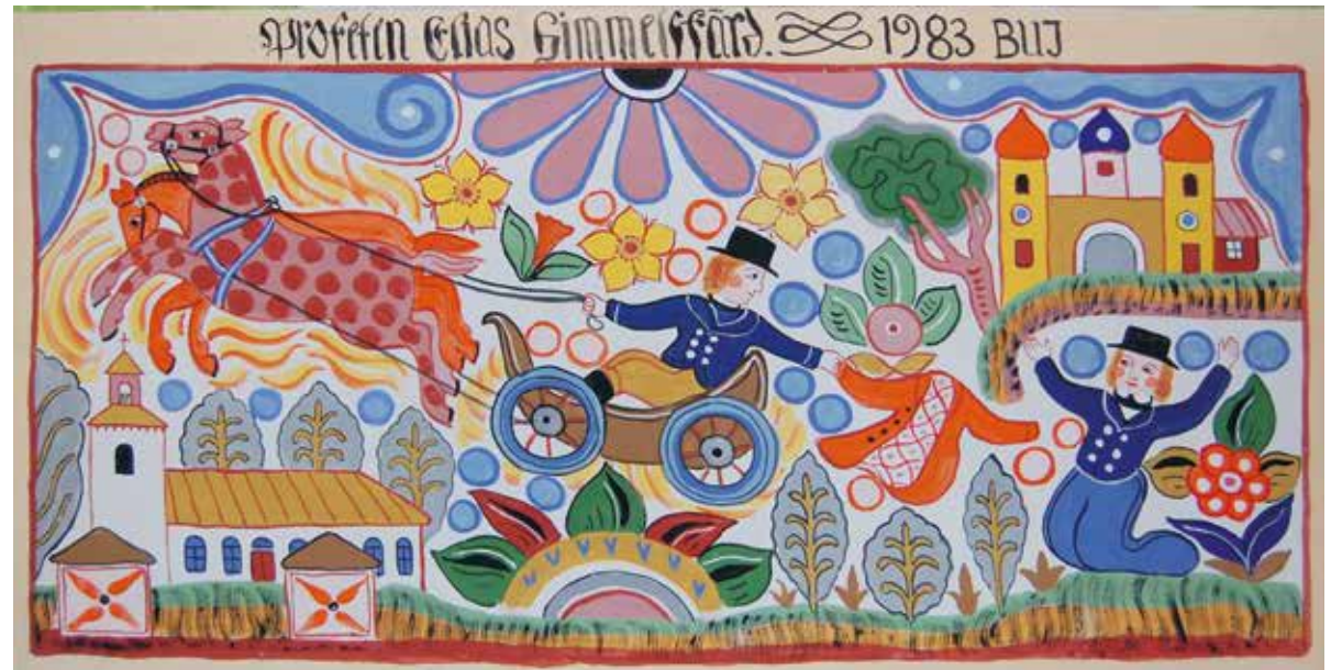
Bernhard Jönsson "Elias himmelfärd", 1983, 100 x 45 cm, textil