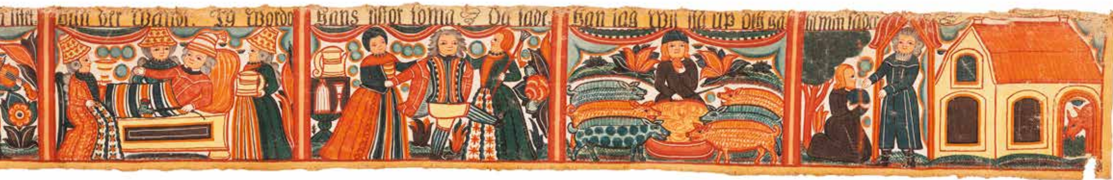
Johannes Nilsson, "Den förlorade sonen", 1808, textil, 478 x 34 cm, UJH 3015