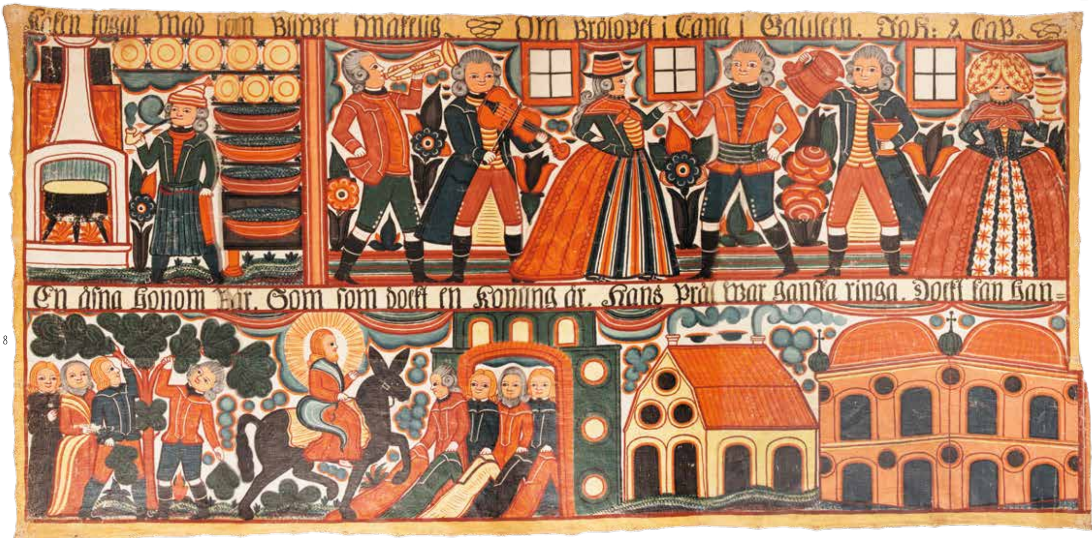
Johannes Nilsson, "Brölpet i Canan", 1808, textil, 190 x 95 cm, UJH 3012