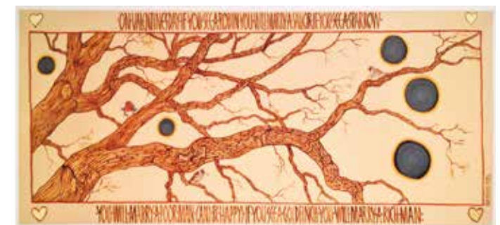
Sue Prince "The Consumer", 2005, 107 x 71 cm, textil