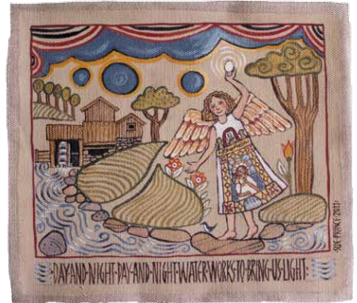
Sue Prince "The Well", 2011, 40 x 30 cm, textil