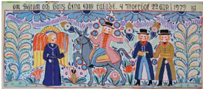
Bernhard Jönsson "Om Bileam och hans åsna som talade", 1979, 100 x 45 cm, textil